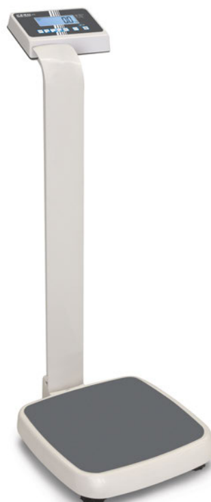
KERN MPE-P avec colonne